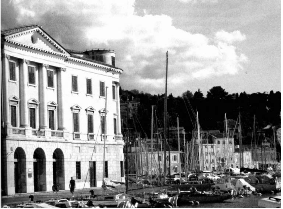
Pirano - Palazzo Gabrielli, dove nacque Diego de Castro, attualmente Museo del Mare