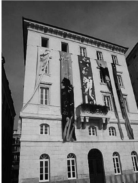
Pirano, 2007 - Scuola Elementare "Vincenzo e Diego de Castro"