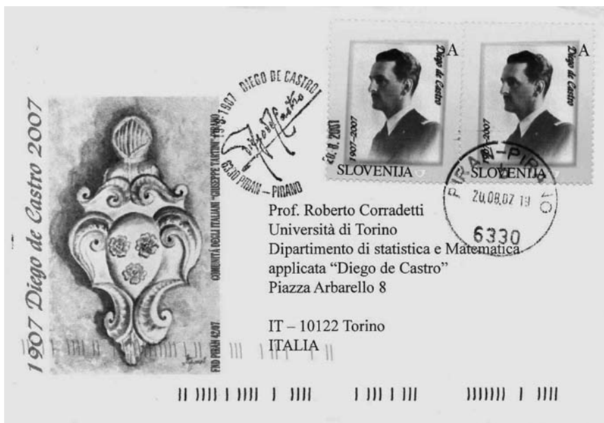
Pirano, 2007 - Francobollo commemorativo emesso dalla Slovenia e busta tematica emessa dall'Associazione filatelica e numismatica di Pirano